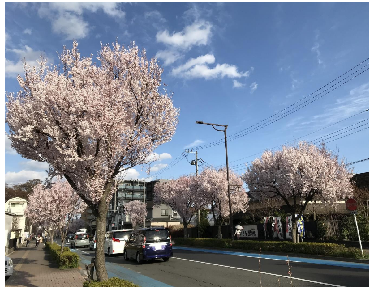
東村山駅東口からスポーツセンターに続く桜並木