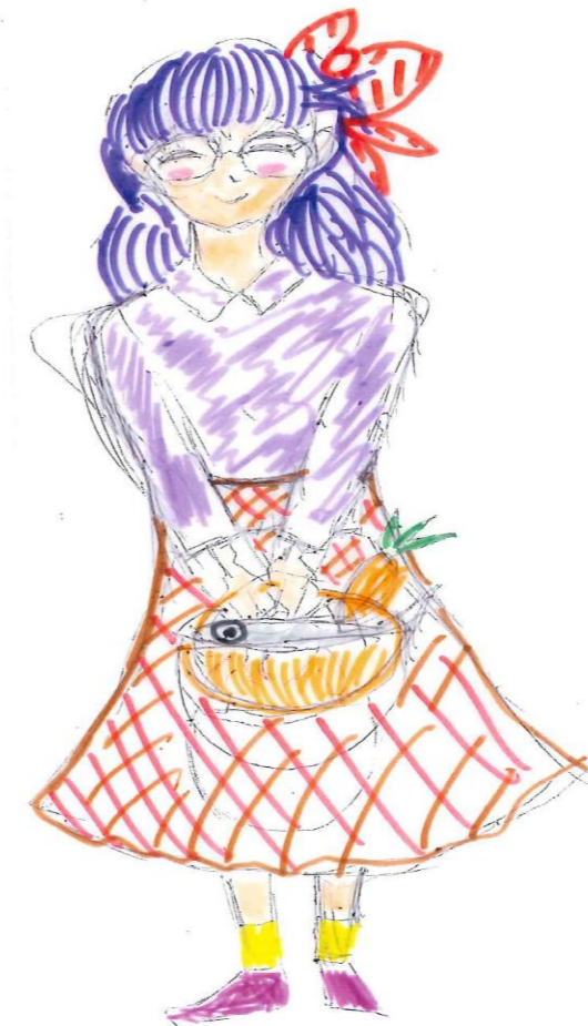
表紙イラスト:福田幸子さん作