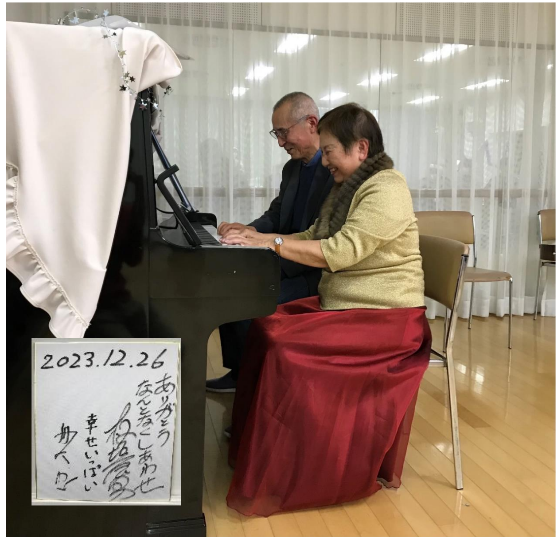
Xmas 会にて