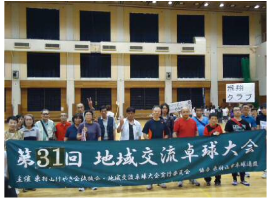
はい、チーズ（ピース）！