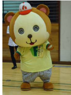
ぼんた君も応援にかけつけてくれました♪