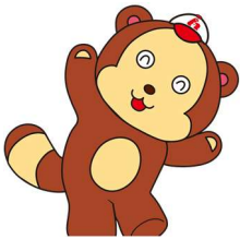
東村山市社会福祉協議会 イメージキャラクター ぼんたくん

結びに、後援会役員一同、次回大会開催に向けて誠心誠意尽力して参りますので今後とも、後援会及び地域交流卓球大会に対し、温かいご支援とご協力を賜りますよう、何卒よろしくお願い申し上げます。