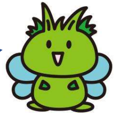
東村山市公式キャラクター 「ひがっしー」